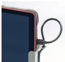
Anschließen der IS940/IS945 Serie.