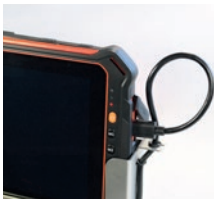
Anschließen der IS930 Serie.