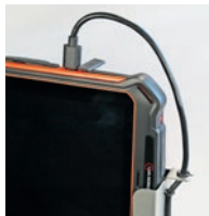
Anschließen der IS910 Serie.