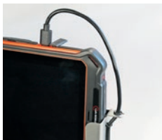
Anschließen der IS910 Serie.