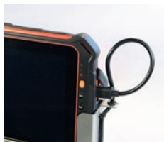
Anschließen der IS930 Serie.